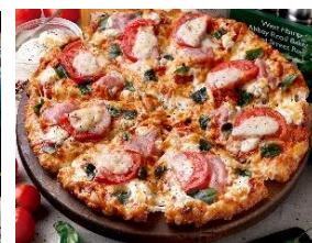
生ハムのマルゲリータ

P ¥2,480 ⇒ ¥2,280 M ¥2,880 ⇒ ¥2,530 L ¥4,600 ⇒ ¥4,050