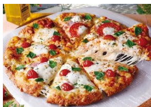
マルゲリータクォーター