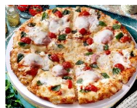
マルゲリータピアンカ

P ¥1,800 ⇒ ¥1,600 M ¥2,140 ⇒ ¥1,790 L ¥3,260 ⇒ ¥2,710