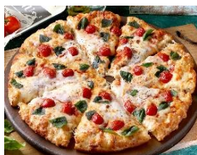
とろけるモッツァの贅沢マルゲリータ

P ¥2,480 ⇒ ¥2,280 M ¥2,880 ⇒ ¥2,530 L ¥4,600 ⇒ ¥4,050