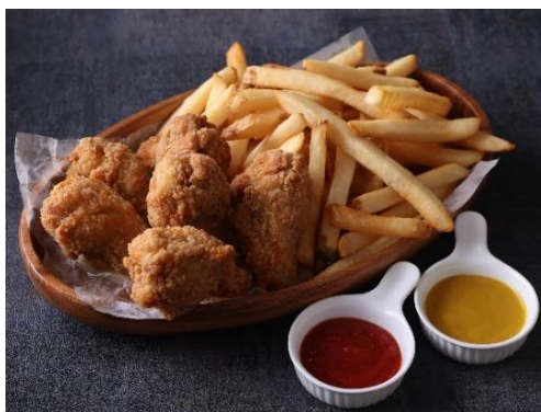
メガ盛りバスケット