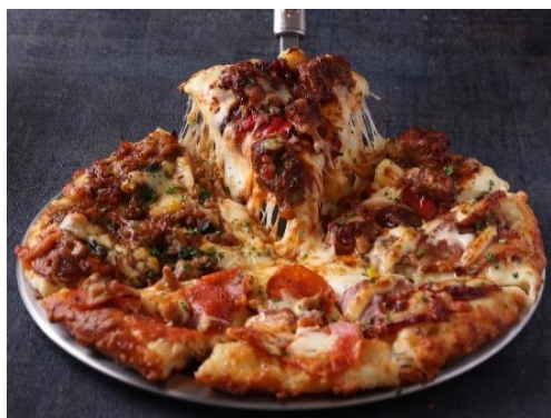
メガ盛りクォーター

メガ盛りピザセット 4,980円 ※コラボステッカー2枚付き 「メガ盛りクォーター」と「メガ盛りバスケット」の組み合わせで100円お得になるセット。 がっつり食べたいパーティータイムにぴったりのボリューム感！