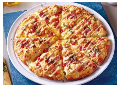
ピザーラ エビマヨ