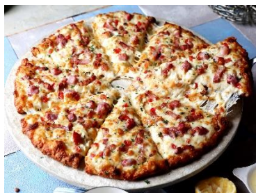
熟成パンチェッタと 瀬戸内レモンソース