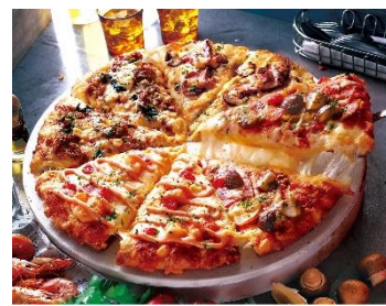
ゲッツ&エビマヨ クォーター

※販売期間・価格は予告なく変更する場合がございます ※価格は全て税込です ※写真はイメージです