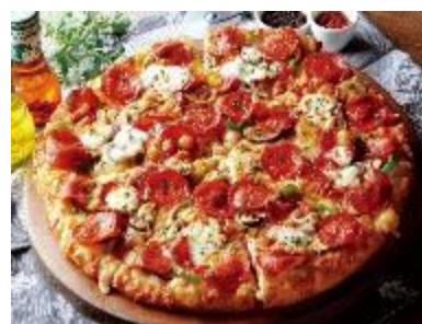
マスカルポーネと 熟成サラミ