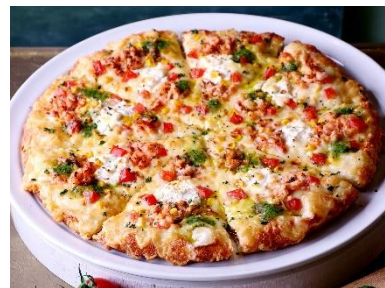
サーモンクリーム ジェノベーゼ