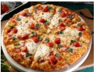
とろけるモッツァの 贅沢マルゲリータ