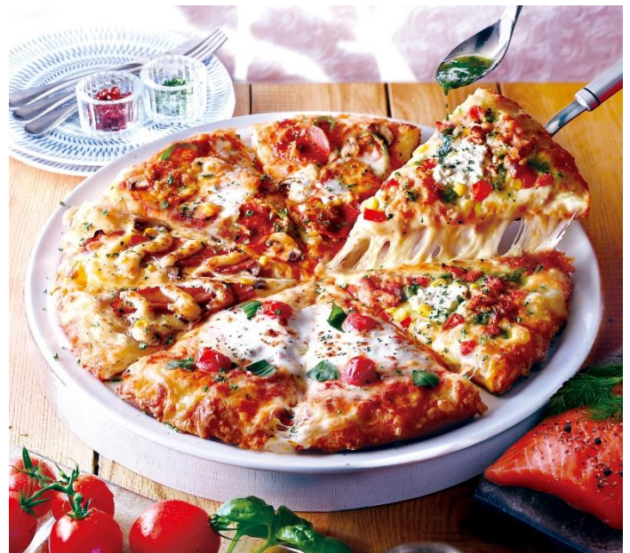
＜春の絶品グルメクォーター＞ M(25cm) 2,480円 / L(36cm) 3,980円 (税込)