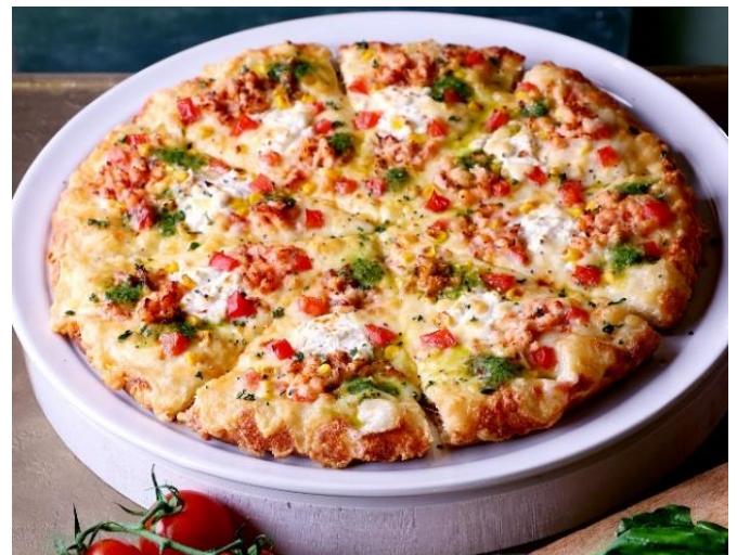
＜サーモンクリームジェノベーゼ＞ M(25cm) ¥2,780 / L(36cm) ¥4,380 (税込)