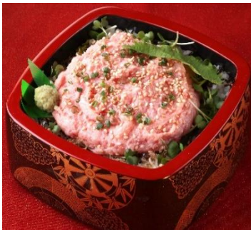
【海鮮2倍盛り】 特選ねぎとろ重 1,450円(税込)

程よくにんにくの効いた特製のユッケダレに漬け込んだ「まぐろ」を通常の2倍量のせた『【海鮮2倍盛り】まぐろユッケ重』は、別添えの温泉玉子をからめて、たっぷりお召し上がりください。