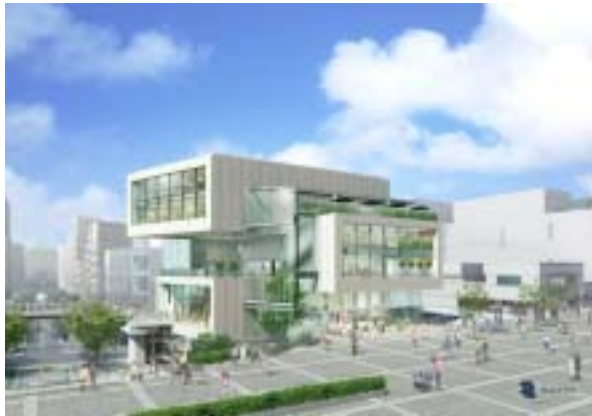
イメージパース(外観)