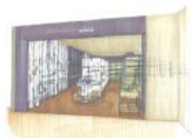
テナント外観イメージ