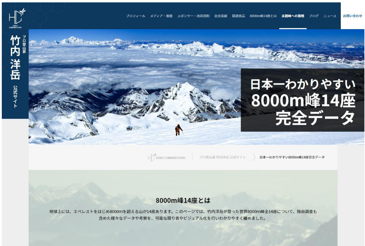
WEBページトップ画面