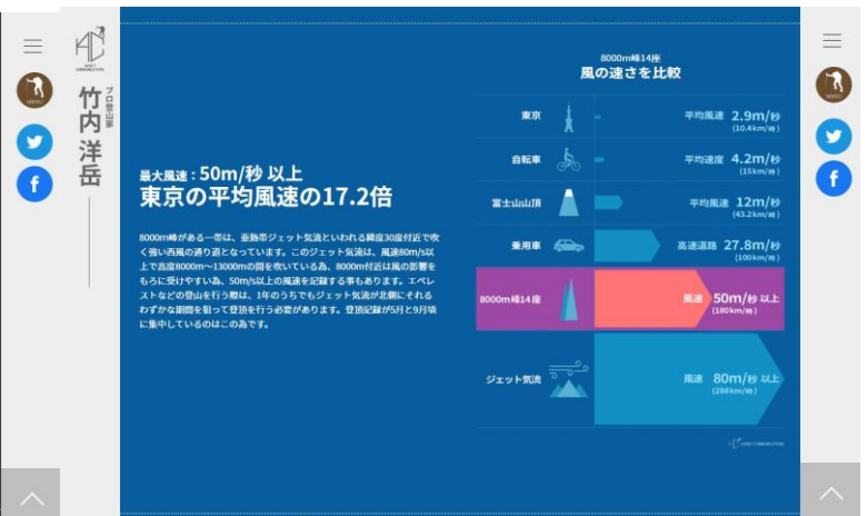
WEBページコンテンツ例2