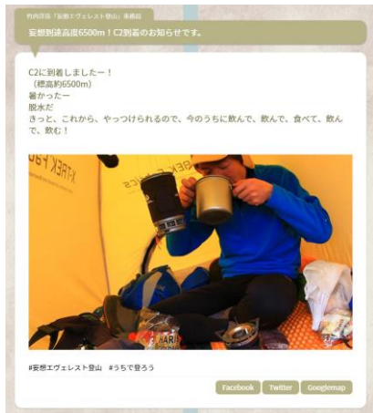
キャンプテント内部