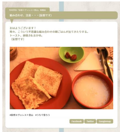
ベースキャンプの朝食