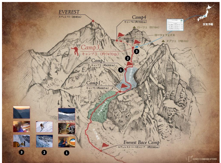
エベレスト日本人初登頂の東南稜ルート