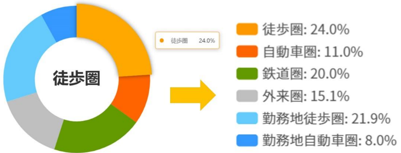
来訪者拠点別比率

分析対象地点の性質や来訪者（来店者など）がどのような範囲から来訪しているかをスピーディーに直感的に把握