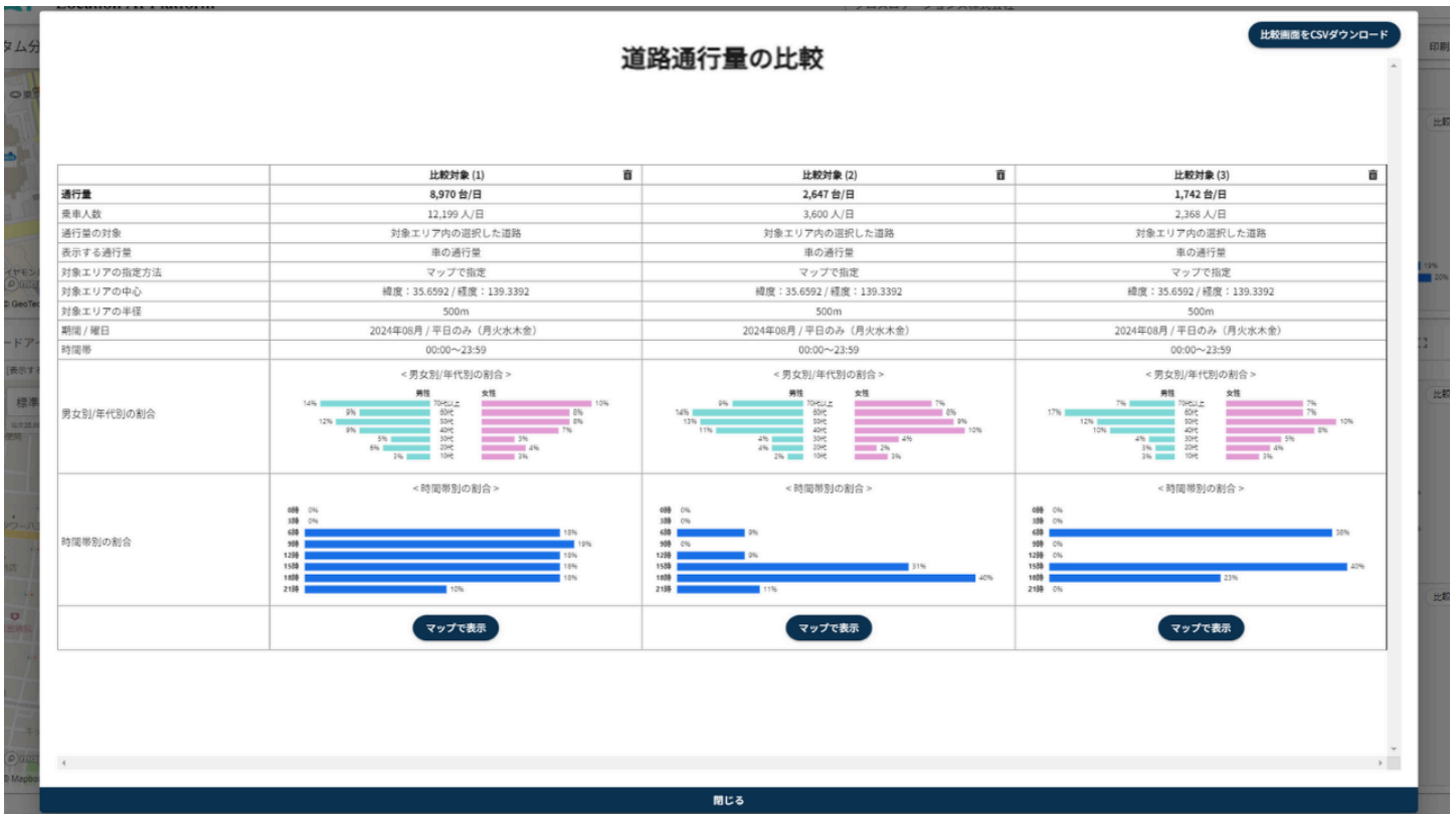
図2. 「道路通行量マップ」機能: 複数の道路の通行量を一度に表で比較