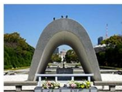
平和記念公園 (広島県)