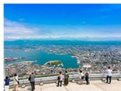
函館山展望台周辺 (北海道)

日本観光振興協会の協力により全国の人気観光スポット10地点を新しく追加 人流動向を詳しく把握することができます。