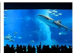
沖縄美ら海水族館周辺 (沖縄県)