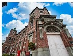
岩手銀行赤レンガ館周辺 (岩手県)