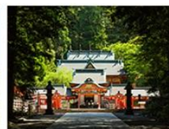
霧島神宮 (鹿児島県)