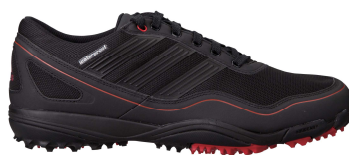
ブラック / ブラック / レッド