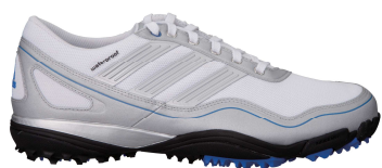
ホワイト / シルバー / サテライト