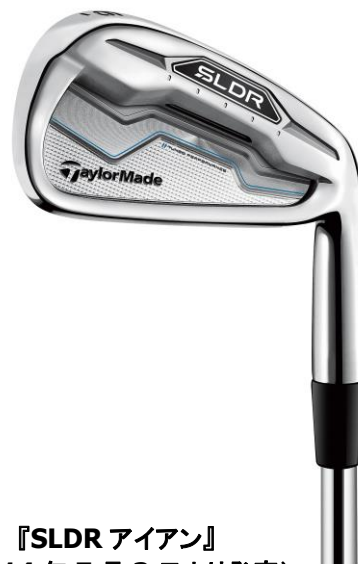
『SLDR アイアン』 (2014年7月3日より発売)

また、各番手に求められる性能を提供するため、#4から#7には、スピードポケット搭載型のアンダーカットキャビティ、#8・#9には、アンダーカットキャビティ、PWからSWには、キャビティバックの番手別設計を採用しました。さらに、スピードポケット内部にはポリマー樹脂を、そしてバックフェースには振動吸収素材を採用したことで、「サウンドマネージングパッチ」との相乗効果により、マイルドな打感と心地よいサウンドを実現しました。ヘッドはクリーンなヘッドシェープを採用、構えやすいヘッド形状が多くのゴルファーのパフォーマンスをサポートします。