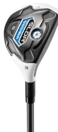
『SLDR S レスキュー』