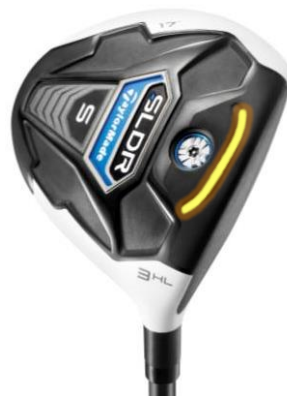
『SLDR S フェアウェイウッド』

貫通型のスピードポケットが、飛距離低下を軽減すると同時に、ロー・フォワード・シージー設計との相乗効果で、高い打ち出し角とロー-spinで大きな飛距離を導き出します。