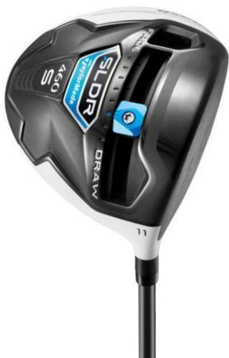
『SLDR S ドライバー』