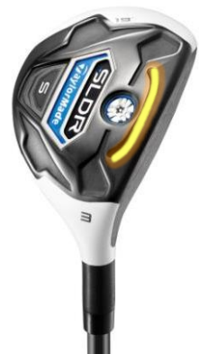
『SLDR S レスキュー』