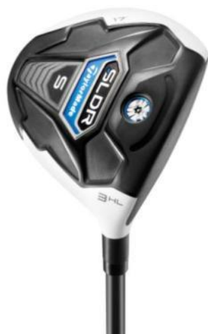
『SLDR S フェアウェイウッド』