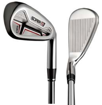
『Idea SUPER S アイアン』