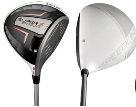
『Speedline SUPER S ドライバー』