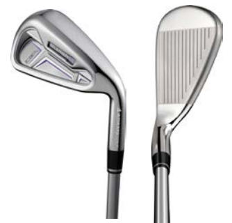
Women's 『Idea SUPER S アイアン』