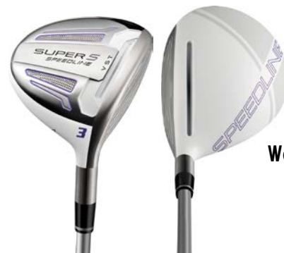
Women's 『Speedline SUPER S フェアウェイウッド』