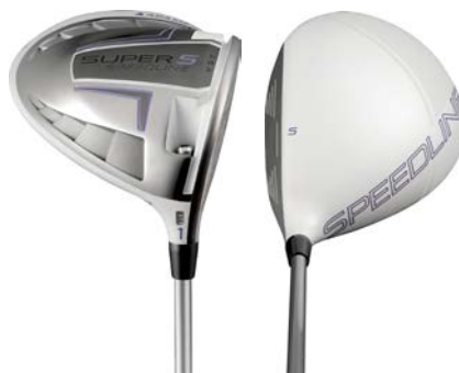
Women's 『Speedline SUPER S ドライバー』