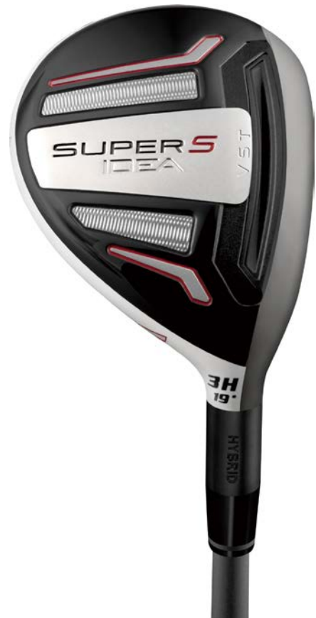
『Idea SUPER S ハイブリッド』

アダムスゴルフは、『SUPER S』シリーズを展開することで、アベレージゴルファーに高弾道をもたらし、多くの人に易しく飛びを提供していきます。