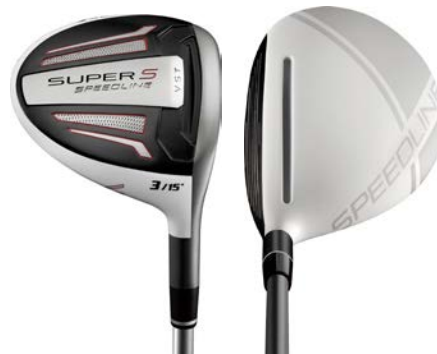
『Speedline SUPER S フェアウェイウッド』