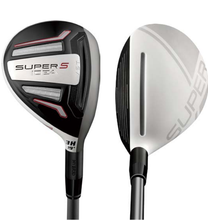
『Idea SUPER S ハイブリッド』