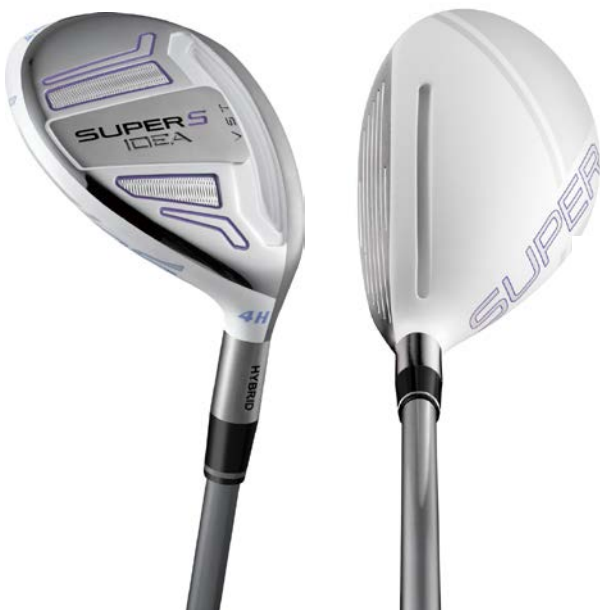
Women's 『Idea SUPER S ハイブリッド』