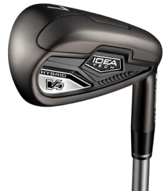
『Idea Tech V4 ハイブリッド アイアン』

『Idea Tech V4 ハイブリッド アイアン』と『Idea Tech V4 フォージド アイアン』は、高い許容性と大きな飛距離を求める幅広いゴルファーのために易しさを追求して開発されました。ヘッドにはABS樹脂バッジをバックフェースに装着し、衝撃・振動を軽減することで、柔らかい打感を実現しました。また「インテグレートッド・アイアンセッティング」を採用し、『Idea Tech V4 ハイブリッド アイアン』には7番～9番、『Idea Tech V4 フォージド アイアン』には6～9番の番手間のレンジ差を0.75インチに拡大することで、飛距離アップに貢献するとともに、V4 ハイブリッドとの組み合わせで適正な飛距離差を持ったクラブセッティングを可能にしています。