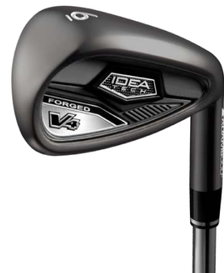
『Idea Tech V4 フォージド アイアン』

また『Idea Tech V4 ハイブリッド アイアン』では、中空構造を採用 ※1 し、重心位置を低く配置することで、各番手から高い弾道でグリーンを狙うことを可能にしています。そして軽量カーボンシャフトを採用したことで、パワーに頼ることなく易しく振り抜くことを可能にしました。