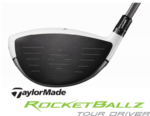
TaylorMade ROCKETBALLZ TOUR DRIVER

フェース形状では、従来の「RBZ ドライバー」より高いディープフェースを採用。ツアープロが唸るような剛弾道を提供します。