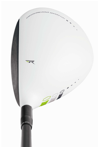
TaylorMade ROCKETBALLZ TOUR FAIRWAY WOODS

TOUR SPOON(13°)で171ccとコンパクトなヘッド形状を採用。 プロ好みのディープでコンパクトなアドレスビューに仕上がっています。