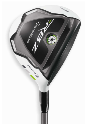
TaylorMade ROCKETBALLZ TOUR FAIRWAY WOODS