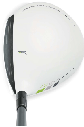
TaylorMade テーラーメイド ロケットボールズ フェアウェイウッド ROCKETBALLZ FAIRWAY WOODS