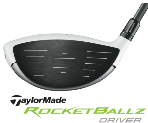
TaylorMade ROCKETBALLZ DRIVER