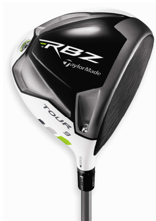
TaylorMade ROCKETBALLZ TOUR DRIVER