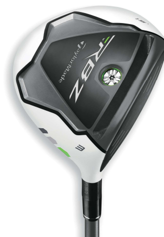
TaylorMade 『ROCKETBALLZ フェアウェイウッド』

瞬発力と爆発力を兼ね備えながらも高いコストパフォーマンスを実現した『RBZ』シリーズではドライバー、フェアウェイウッド、レスキュー、アイアン、ボールをラインナップ。様々なゴルファーに対してやさしさと大きな飛距離を提供します。中でも『RBZ フェアウェイウッド』はスピードポケット構造を採用したことで初速向上および高い飛距離性能を実現。従来のフェアウェイウッド(#3)に比べて最高で17ヤード*の飛距離向上が確認されています。