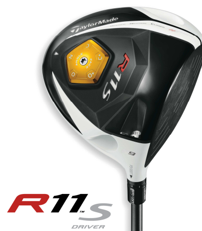
『R11S ドライバー』 (発売中)

『R11S ドライバー』では、新たに5通りのフェースアングル調整を可能にするNew「ASP(アジャスタブル・ソール・プレート)」を搭載。ロフト調整機能の「FCT(フライト・コントロール・テクノロジー)」、そして弾道調整を可能にする「MWT ® (ムーバブル・ウェイト・テクノロジー)」の3つの調整機能を組み合わせることで80通りの弾道調性が可能。さらに、ホワイトカラーを施したクラウン部がアドレス時における安心感と集中力向上に貢献。ブラックPVD加工されたフェースとのコントラストがターゲットに向かって正確なアドレスをサポートします。また、460CCのオーソドックスなヘッド形状が高い慣性モーメントと低深重心化を実現、高い直進性と大きな飛距離を導き出します。