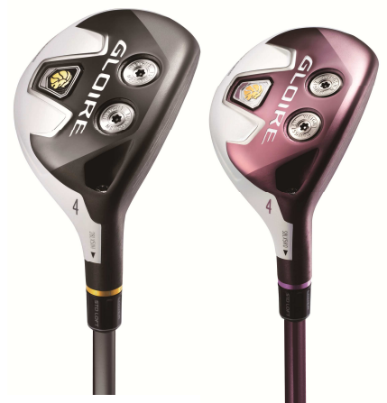
『GLOIRE レスキュー』(左) Women's 『GLOIRE レスキュー』(右) (2012年12月発売予定)