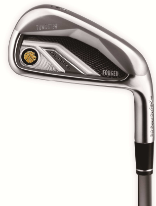
『GLOIRE FORGED アイアン』 (2012年12月発売予定)

テーラーメイドでは、『GLOIRE FORGED アイアン』と『GLOIRE レスキュー』のラインナップにより、『GLOIRE』シリーズのさらなる拡充を図り、多くのゴルファーに“やさしさと飛びやすさ”を引き続き提供していきます。