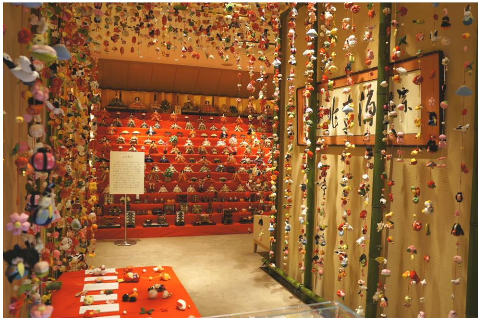
2 階特設会場の十三段雛飾りには 103 体の雛人形を展示

株式会社 宗家 源 吉兆庵（本社所在地：東京都中央区銀座 7 丁目 8-9、代表取締役社長：岡田 憲明）は、第 4 回 ひな人形鑑賞会を 1 月 15 日（火）から 3 月 3 日（日）まで、宗家 源 吉兆庵 銀座本店 2 階特設会場にて開催いたします。「桃の節句」にあわせて女の子の健やかな成長を願い、豪華な十三段雛飾りや約 800 本の愛らしいつるし雛などを展示いたします。