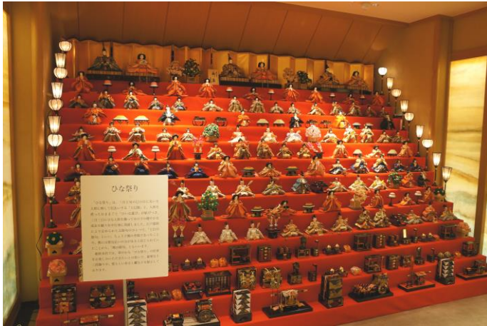
(左) 103体のひな人形が展示された十三段雛飾り