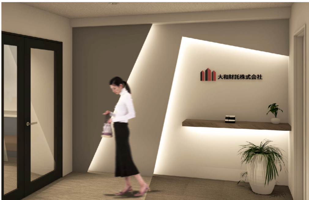
※エントランスイメージ

そして、首都圏の顧客に対し大阪本社同様の資産運用のフルサービスを提供できる体制となったこと、及び管理部門を備えたことにより、「東京支店」を「東京本社」に改称し、東京・大阪の両拠点を本社とする二本社制へと移行することとなりました。