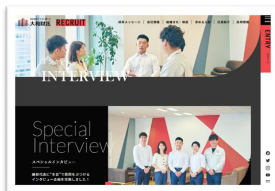
社員インタビュー