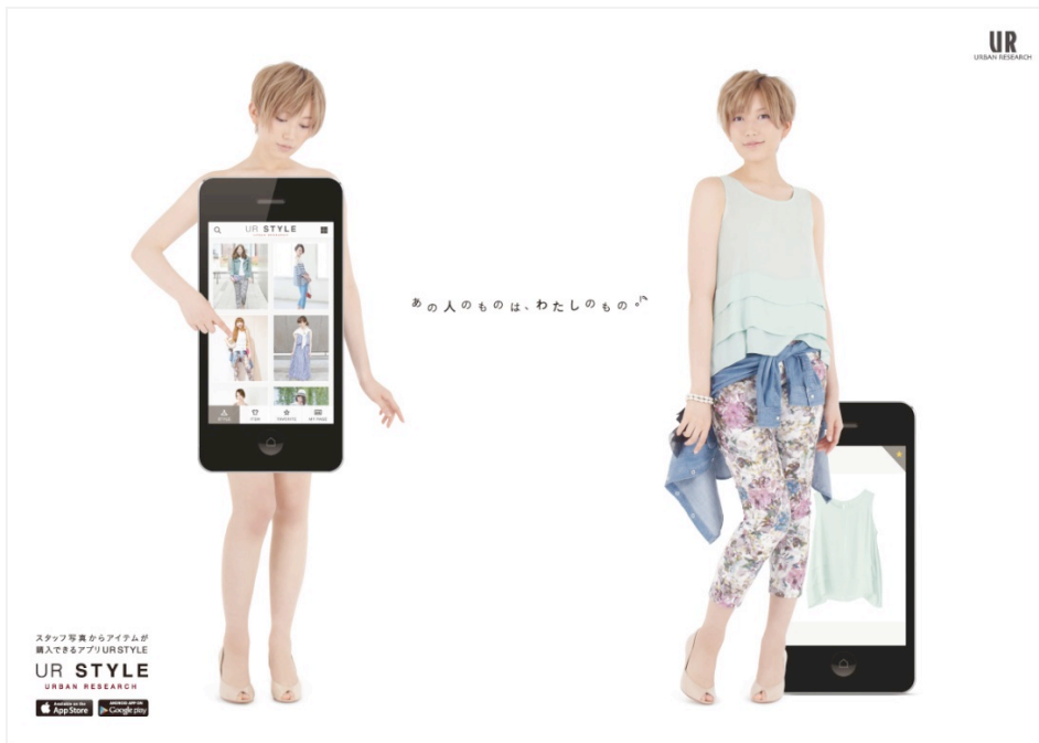
【告知用ポスター】 全国のショップにて掲載予定