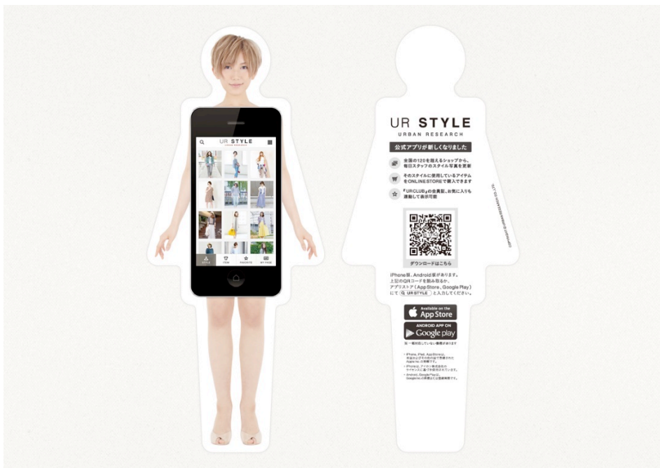
【告知用フライヤー】 全国のショップにて配布予定