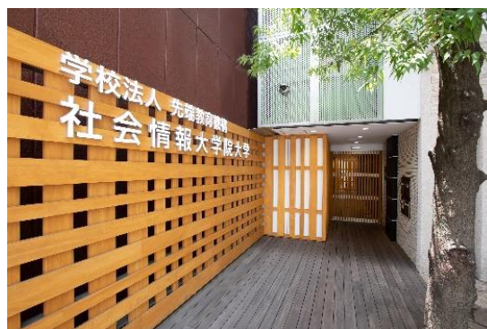
社会情報大学院大学 外観

社会情報大学院大学は、学校法人先端教育機構の「知の実践研究・教育で、社会の一翼を担う」の理念に基づき、組織の理念を基軸に広報・コミュニケーション戦略を立案・実行する人材の育成を目指し、広報・情報研究科を設置しています。修了者には、専門職学位の「広報・情報学修士」(MICS: Master of Information & Communication Studies)が授与されます。