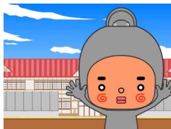
〈第4回サイバーフロント杯銅賞〉