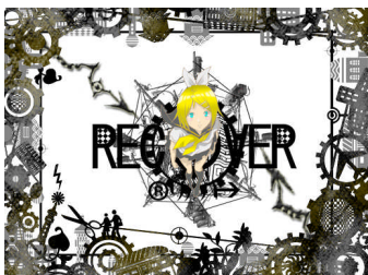
〈第4回サイバーフロント杯金賞〉