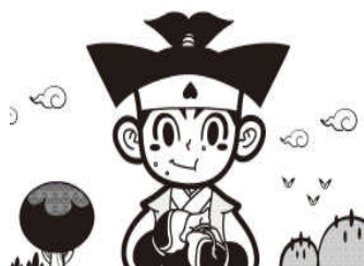
〈第3回サイバーフロント杯〉