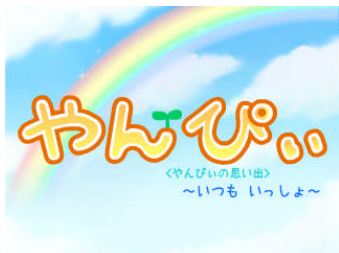
〈第3回サイバーフロント杯金賞〉