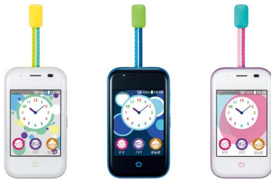
「セコムみまもりホン」専用端末（※1） （左からホワイト、ブルー、ラベンダー。3色をラインアップ）

セコム株式会社（本社：東京都渋谷区、社長：中山泰男）は、高齢者や持病のある方とその家族のニーズに応える新サービス「セコムみまもりホン」を本日販売開始します。