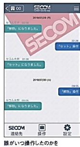
誰がいつ操作したのかをひと目で把握できます。

警備セット／解除などの操作履歴は、タイムライン形式で分かりやすく表示。また、誰がいつ操作をしたのかを確認できます。