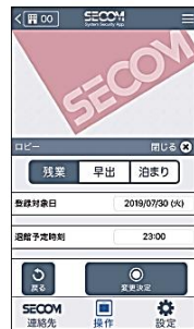
警備セットの時間を変更することができます。

遅くまでオフィスに残らなければならない場合には、警備セットの時間を変更することができます。