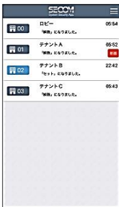
各テナントの警備状態を一覧で確認できます。

スマートフォンでテナントごとの警備セット／解除などの操作がカンタンにでき、表示も見やすいです。