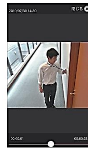
操作を行った人物を画像で確認できます。