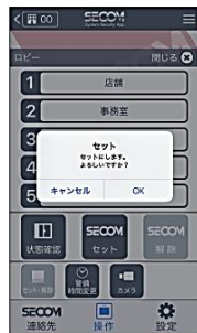
個別に警備セット／解除操作ができます。