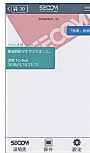
変更されるとタイムラインに表示されます。