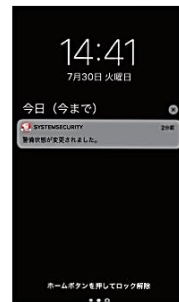
警備セット／解除などの操作が行われると、プッシュ通知でお知らせします。

警備セット／解除などの操作が行われるとプッシュ通知でお知らせ。外出先からも施設の状況を確認できます。