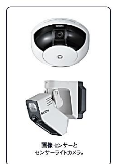
画像センサーとセンサーライトカメラ。

画像センサーやセンサーライトカメラの映像をいつでもどこでも確認でき、オフィスなど施設の状況を把握できます。