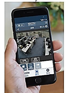
施設の状況を画像で確認できます。