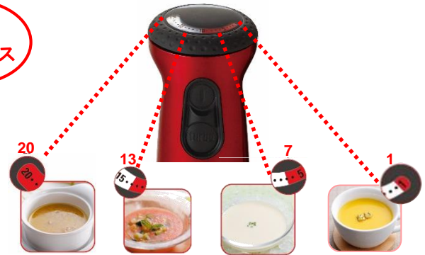
パーニャカウダ ガスパッチョ ヴィンソワーズ かぼちゃのポターージュ