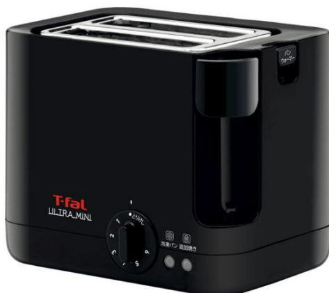
ソリッドブラック

限りある収納スペースに配慮したコンパクトなデザインと、洗練されたこだわりのカラーでキッチンをスタイリッシュに彩ります。