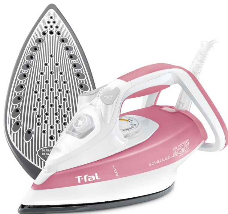
＜ウルトラグライド4671＞