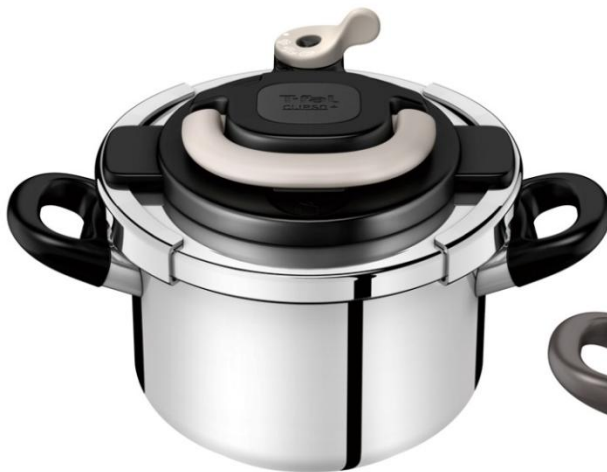
＜クリプソアーチ アイボリー＞

カラーは、パプリカレッドとアイボリーの2色展開。お好みのカラーで手軽に楽しく、安心して毎日のお料理にお使いいただけます。