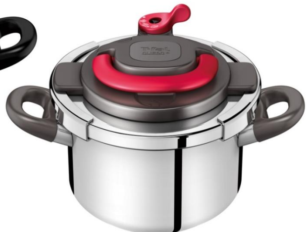
＜クリプソアーチ パプリカレッド＞