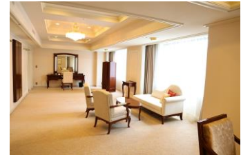
プライベートサロン

到着後、専用のお手続きカウンターへご案内。 並ばず、待たずのストレスフリーなコンシェルジュチェックイン。