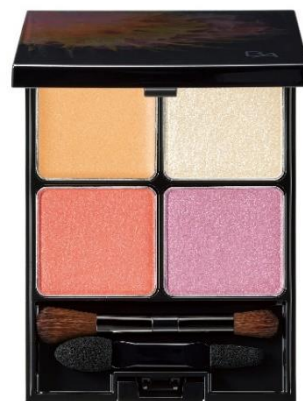
EX01 サンシャインブーケ