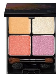
EX01 サンシャインブーケ