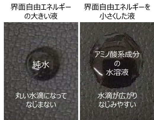
図3. 人工皮革に対するなじみやすさ