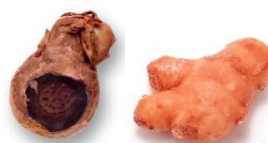
ダブルジンジャー