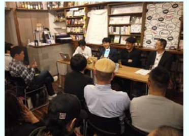
1/25(水)きたがわ翔先生トークイベントの様子

URL: https://freshlive.tv/mangasalon_trigger/76106