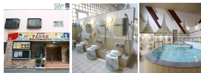
寿恵弘湯(川崎市川崎区大師駅前)

昭和31年の黒湯の掘削以来、50年以上枯れることなく湧き出している天然温泉(ナトリウム炭酸水素塩泉)が自慢の銭湯です。黒湯は色が非常に濃く、湯あたりが滑らかで、入浴後もなかなか湯冷めしないという特徴があります。脱衣場にはジャズが流れ、浴室内にはスチームサウナ(無料)と涼み場も完備。大広間では新年会も開催可能です。