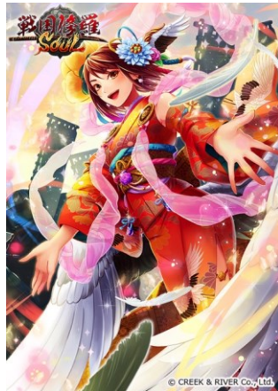
戦う歌姫・鈴木亜美姫(☆5)