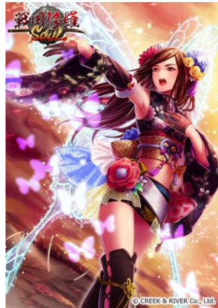
歌と絆・鈴木亜美姫(☆5)