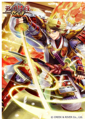
真田継承・真田大助(☆5)