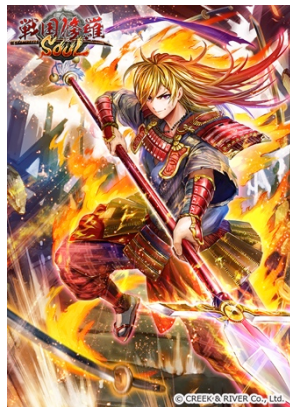
開花夭折・真田大助(☆5)