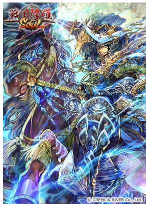
伊達継承・伊達忠宗(☆5)