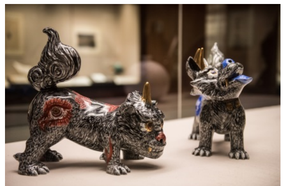
大英博物館の展示ケースに所蔵された『狛犬』