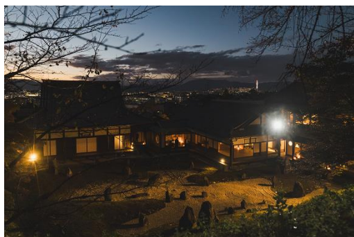
和ろうそくで照らされた夜の「光明院」