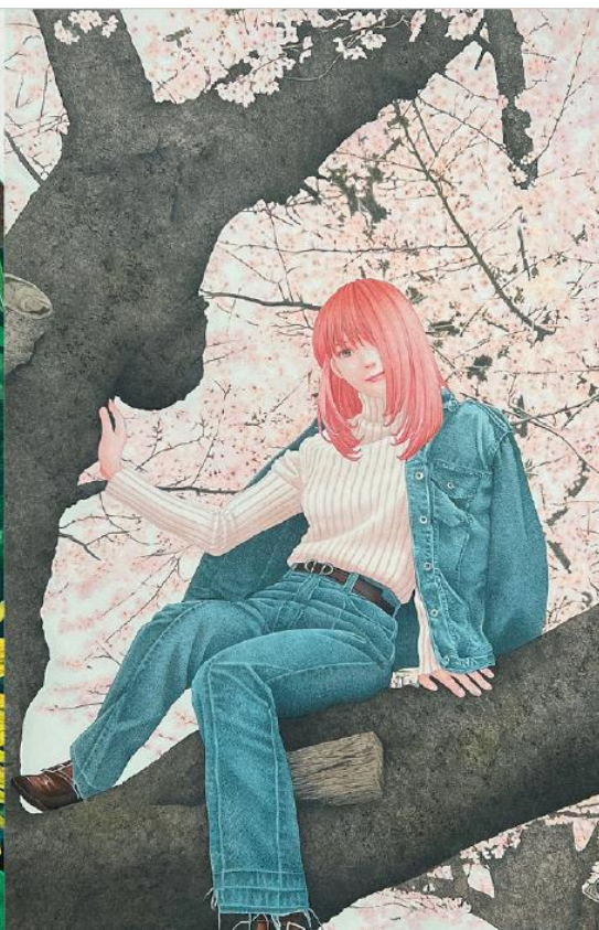
原画を展示予定の『千夏のうた』イラスト（左）と描き下ろしのアート作品（右）