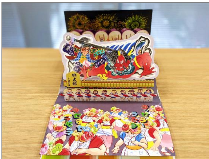
大迫力のねぶたが飛び出す色鮮やかな仕掛け絵本が完成！

当社は、青森の伝統文化の継承に貢献できる製品づくりを特徴としており、ねぶたの学習・体験ができる「ねぶたカンタンキット」などの企画・制作・販売をしています。今回は主力事業である製本業で培った製本技術を活用した新製品の企画にチャレンジしました。専門家チーム(プロデューサー、デザイナー、知的財産コーディネータ)からは、当社の技術力と特色を踏まえた「青森の文化が詰まった仕掛け絵本」の製品案を提案いただきました。「青森の文化が詰まった仕掛け絵本」は、子どもが楽しみながら青森の文化に触れる・学ぶことができることをコンセプトとしています。今回、飛び出す仕掛けのパーツが35種あり、すべて手作業で一つひとつ組み立てています。