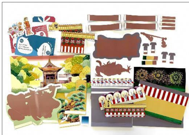
仕掛けパーツの組み込みはすべて手作業

当社は、青森の伝統文化の継承に貢献できる製品づくりを特徴としており、ねぶたの学習・体験ができる「ねぶたカンタンキット」などの企画・制作・販売をしています。今回は主力事業である製本業で培った製本技術を活用した新製品の企画にチャレンジしました。専門家チーム(プロデューサー、デザイナー、知的財産コーディネータ)からは、当社の技術力と特色を踏まえた「青森の文化が詰まった仕掛け絵本」の製品案を提案いただきました。「青森の文化が詰まった仕掛け絵本」は、子どもが楽しみながら青森の文化に触れる・学ぶことができることをコンセプトとしています。今回、飛び出す仕掛けのパーツが35種あり、すべて手作業で一つひとつ組み立てています。