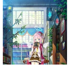
夜ノみつき『森の司書』

クリエイターファースト。日本アニメ・コミック特化のプラットフォーム「ANIFTY」 https://anifty.jp/ja