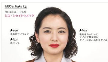
【1950's Make Up】 ミス・シセイドウメイク