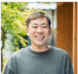
【株式会社スピッカート】