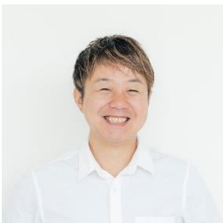
【株式会社アールイーデザイン】