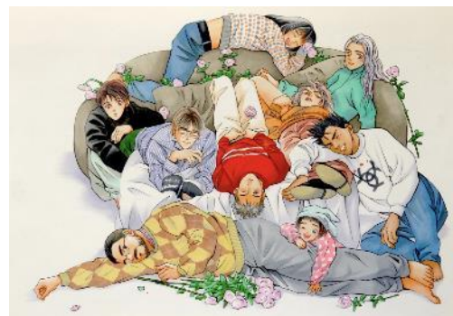
原画を展示予定の『HOTMAN』イラスト

2019年から始まった関西での原画展も今年で3回目となりました。なお今年は私の画業40周年ということで、懐かしい作品の原稿をたくさん展示しております。私がCDジャケットのイラストを担当したミュージシャンの天道清貴氏とのミニライブなども予定しております。どうぞ気軽にお立ち寄りくださいませ。