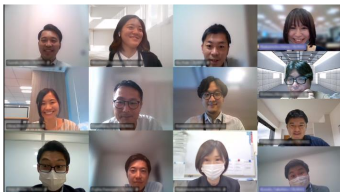
エリア戦略グループのオンラインMTGの様子