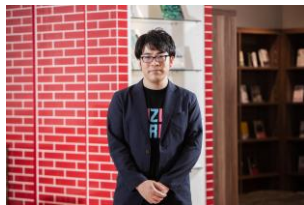
株式会社ドズル ドズル氏